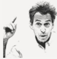
PAR MARTIN VANIER Professeur à l'École d'urbanisme de Paris